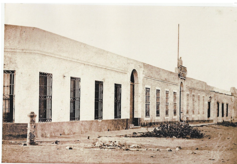
Frente del Colegio Nacional anterior a 1926 con un cañón naval clavado como poste en la esquina.