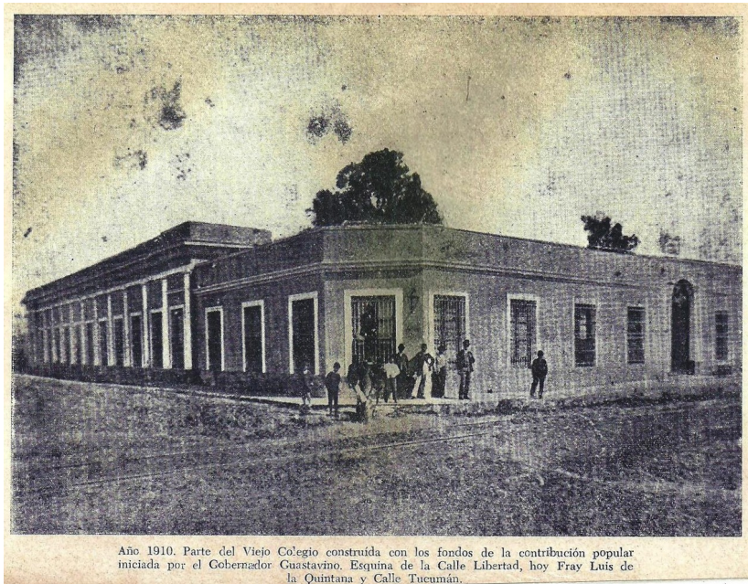
Año 1910. Parte del Viejo Colegio construida con los fondos de la contribución popular iniciada por el Gobernador Guastavino. Esquina de la Calle Libertad, hoy Fray Luis de la Quintana y Calle Tucumán.