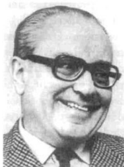
Profesor Dr. Enrique Romero Brest

Además en esa época los colegios no contaban con profesores preparados para Educación Física pero tenían horas cátedras asignadas desempeñándose como tales. Esta situación determinó que por decreto Ministerial del 8 de Octubre de 1901 se creó el primer Curso de Educación Física de vacaciones a funcionar desde el 20 de Diciembre de 1901 hasta el 20 de Febrero de 1902 bajo la dirección del Dr. Enrique Romero Brest quien creó en ese año el primer sistema Argentino de Educación Física vigente hasta 1938 y el juego "Pelota al Cesto" que junto con El Pato" constituyen los dos únicos deportes de origen Argentino).